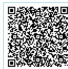
申込み QR コードです

※恐れ入りますが、振り込みの際、お名前を記入してください。 ※7月21日（月）までにお振り込みをお願い致します。 ※21日（月）までに振込が間に合わない場合は、当日領収書等の提示をお願いします。